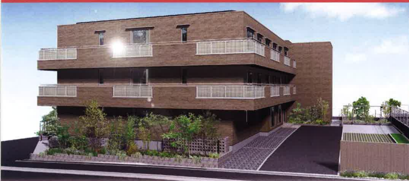
※外観パースは実際の図面をもとに描き起こしたのですが、外構は実際のものと異なる場合がございます。予めご了承ください。